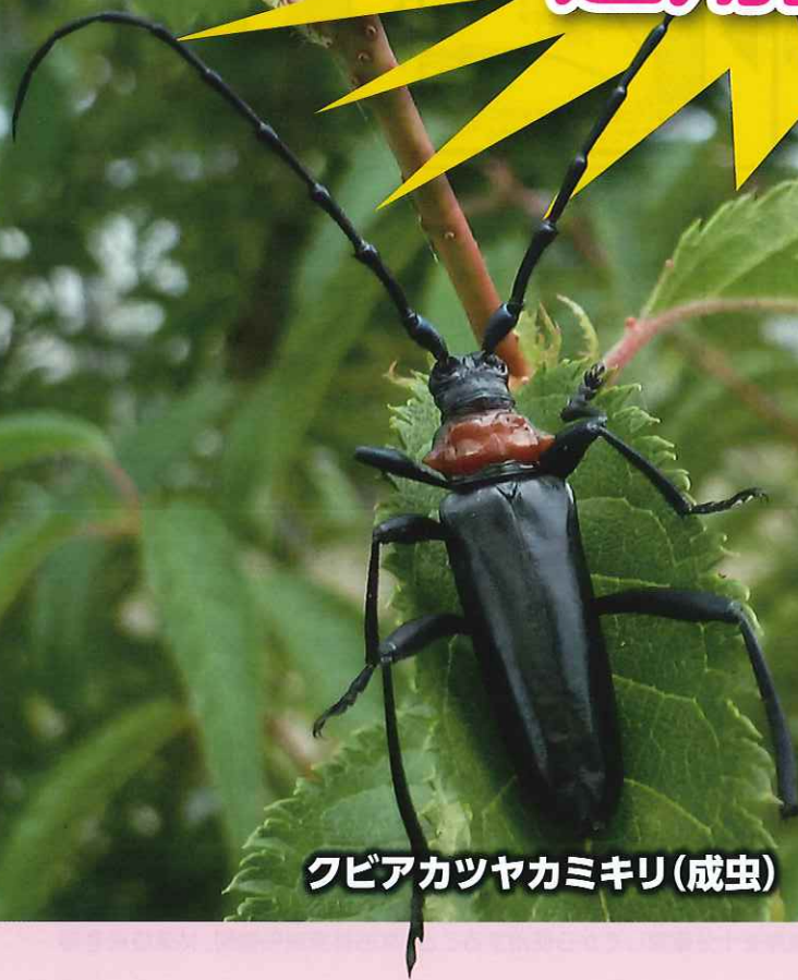
クビアカツヤカミキリ(成虫)