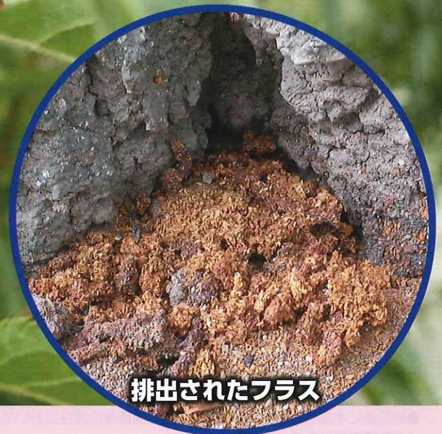
排出されたフラス