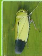
ツマグロヨコバイ