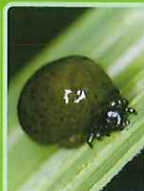
イネドロオイムシ