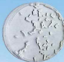
MIC®ナメクジ退治 浸水24時間後