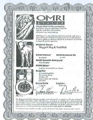
米国有機栽培農薬認証

食べられません。ペットや鳥などが食べないように注意して下さい。 眼に入った場合は直ちに水洗し、眼科医の処置を受けて下さい（刺激性） 保管…飲食物・食器類やペットのえさと区別し、直射日光をさけ、密封して、小児の手の届かない冷涼・乾燥した所。