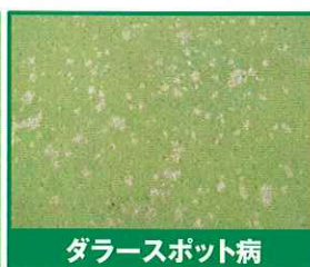
ダラースポット病