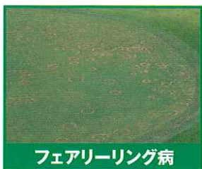
フェアリーリング病