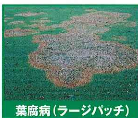
葉腐病(ラージパッチ)