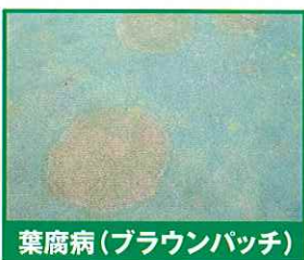
葉腐病(ブラウンパッチ)